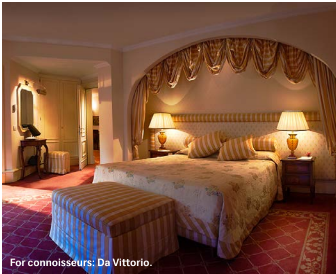
For connoisseurs: Da Vittorio.